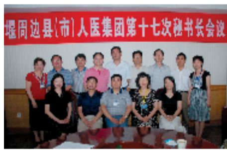
人医集团秘书长合影

“人民医院为人民”的集团宗旨落实到行动上,一切以人民是否满意为标准,简化服务流程,合理用药治疗,实行价格公开,提高服务质量,确保患者安全。创新惠民措施,减轻患者负担,维护患者利益,要像品牌连锁企业一样维护集团的形象,让人医集团的品牌在全省乃至全国产生一定的影响。