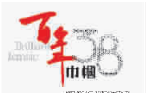
十堰日报纪念三八国际妇女节特刊