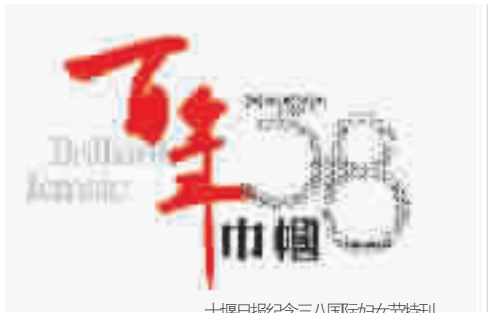
十堰日报纪念三八国际妇女节特刊

她自小热爱文艺,上高中时已显露表演天赋。为了实现自己的表演梦,她三上武当求见名导。现在,她已拍完自己的第一个荧屏角色。仍在求学的她对未来满怀憧憬,立志做一个全能艺人。