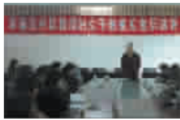
第七届村居换届妇女干部模拟竞聘演讲。