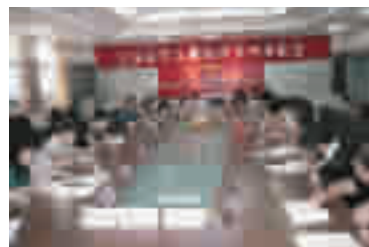
全区妇女儿童维权工作座谈会。

关爱妇女儿童，是妇联的一项重点工作。2008年，她们克服经费、场地不足困难，充分利用和整合各方资源，在赛武当广场群众活动中心争取了一块活动阵地，经过短时间的筹建，区妇女儿童活动中心已正式成立。她们还以服务全区妇女儿童、提高妇女儿童素质为宗旨，开展了各类有益妇女儿童身心健康的活动，提供妇女儿童心理、卫生保健、家庭教育、法律知识咨询，以及各类文化知识、技能培训等。活动中心成立了金箭艺术团，成员达80多人。中心成立后先后组织参与了和“留守儿童”手拉手、慰问福利院老人、新农村展示演出和东部新城社区文化节等活动，通过实践活动增强了孩子们的爱心和责任心。在去年庆祝新中国成立六十周年之际，她们以活动中心为依托，举办了面向全国的“我与大自然”儿童绘画大赛，收到了来自国内外548幅儿童绘画作品，并邀请到台湾知名设计师魏渊源参加评审，并将评选出来的金银铜奖作品做成展板在赛武当广场文化墙上长期展示，得到社会各界一致好评。