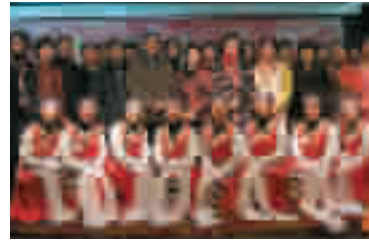
女创业者联谊会迎新春茶话会。