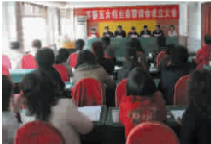
女创业者联谊会成立大会。