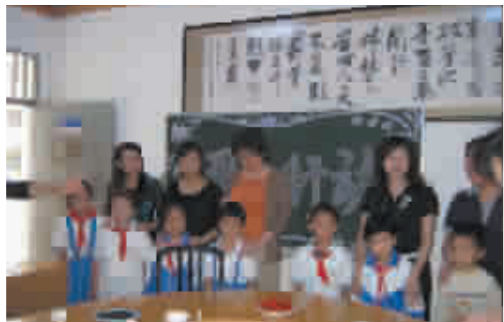
爱心妈妈和留守儿童结对帮扶。