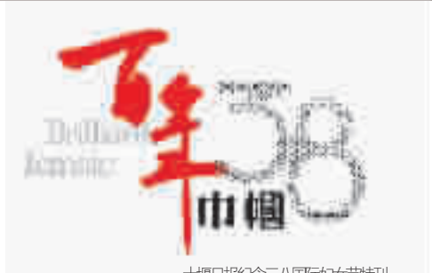
十堰日报纪念三八国际妇女节特刊