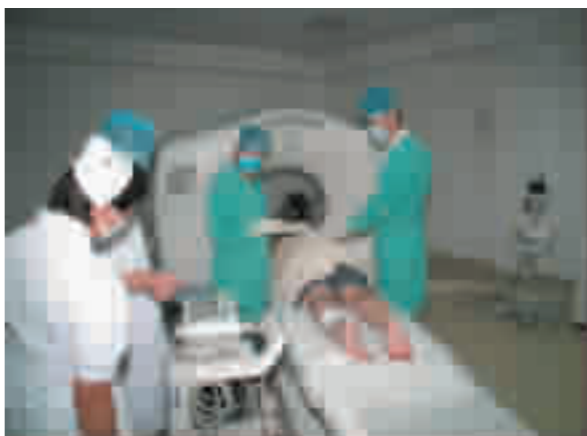
腰椎间盘突出射频治疗。