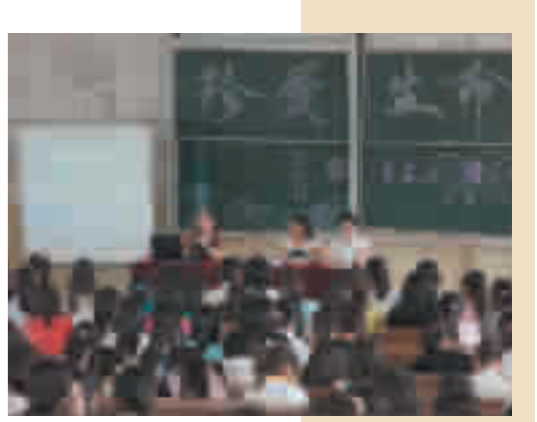
妇女健康知识讲座