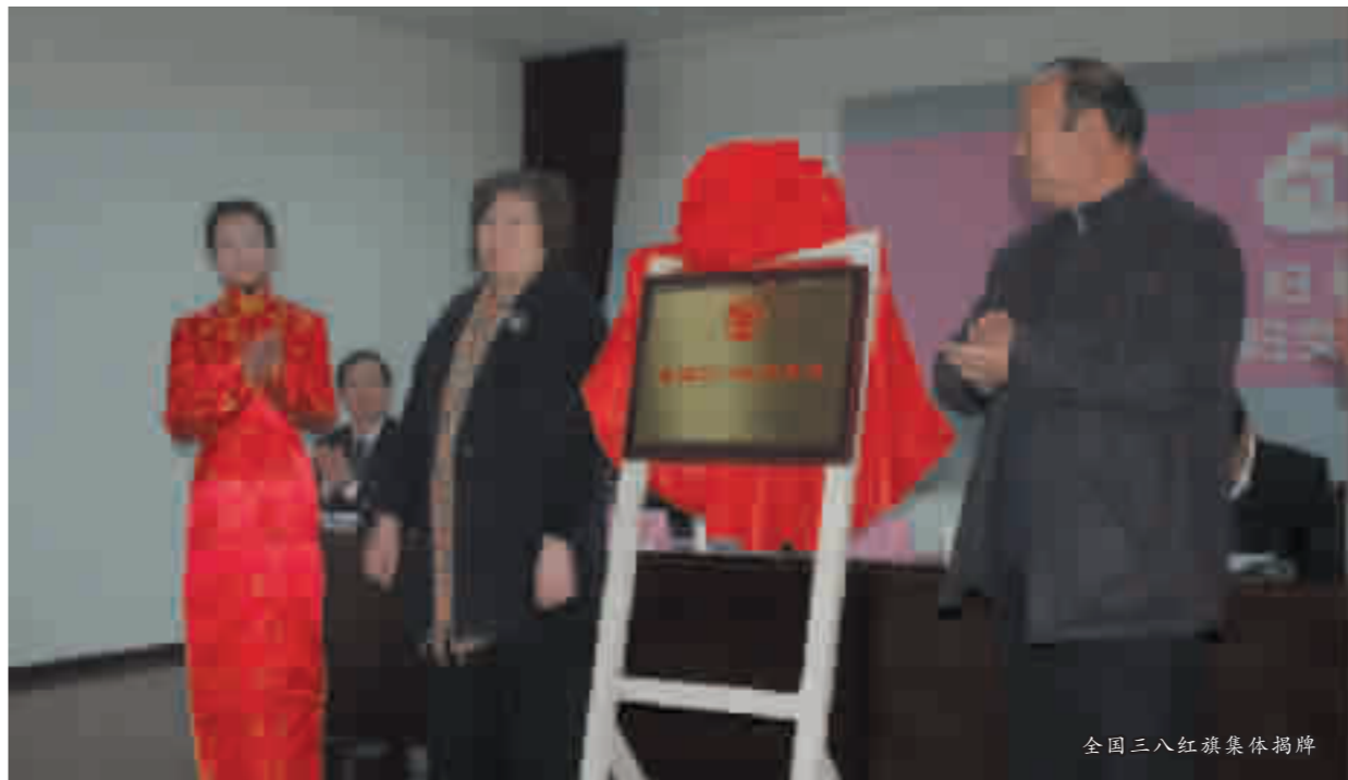
全国三八红旗集体揭牌