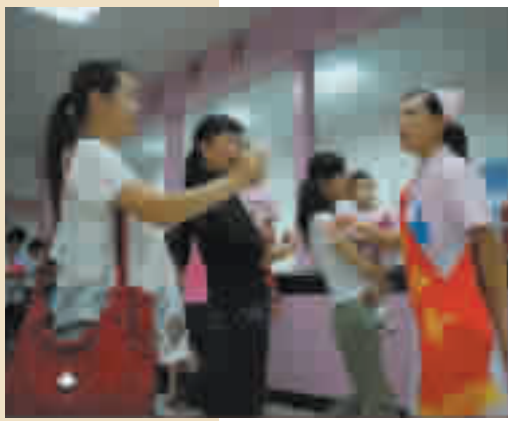
宽敞明亮的门诊大厅