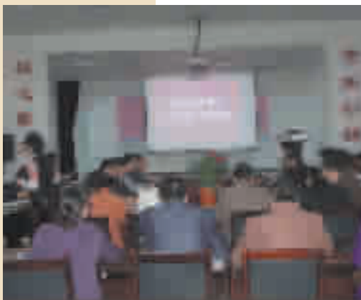
孕产妇死亡评审现场