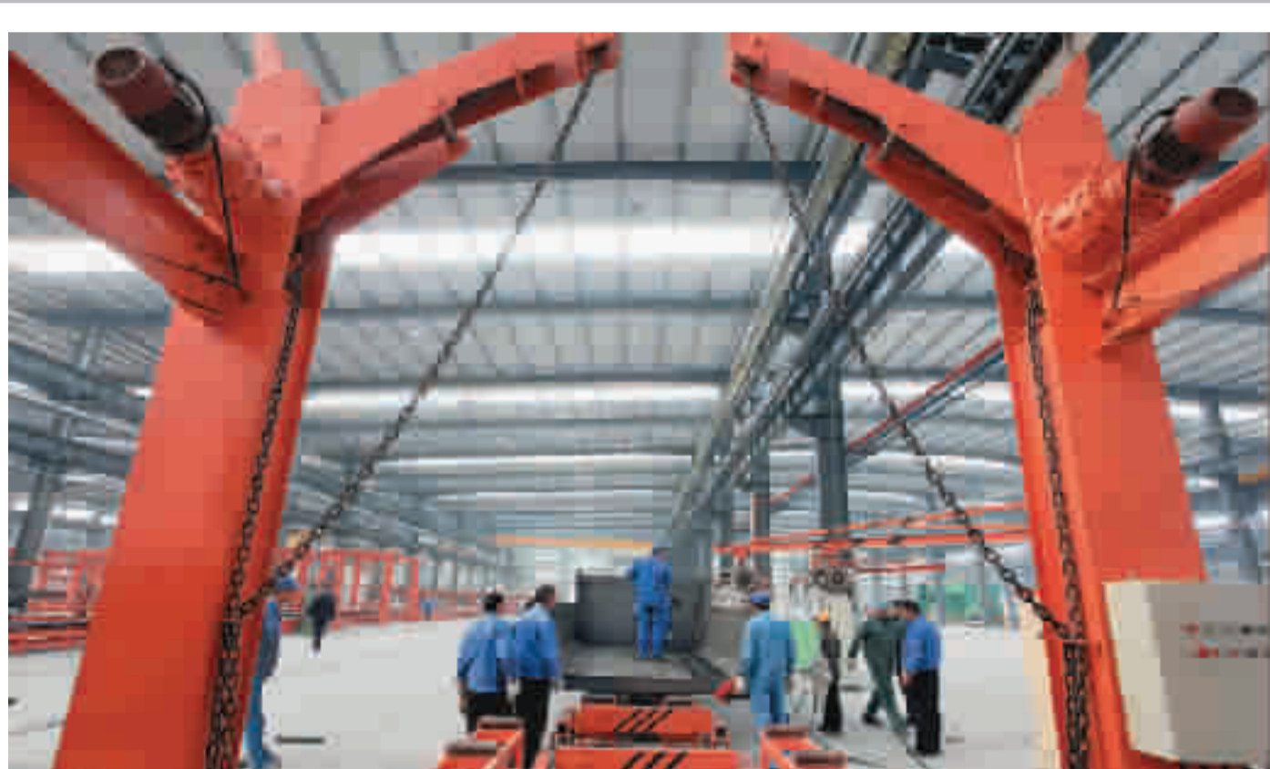
2月27日，十堰工业新区的东风征梦公司工人正加紧生产。今年以来，张湾区组织入驻企业加快项目建设，确保项目竣工一批、投产一批。目前，入驻张湾区的东