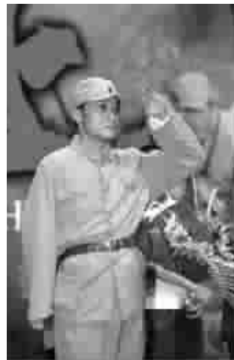
抗战大片《太行山上》,中国香港著名演员梁家辉扮演独臂将军贺炳炎。

1960年7月1日,贺炳炎将军因病去世,年仅47岁。1960年7月5日,成都军区在蓉城举行公祭,数十万军民冒雨云集在北校场,为将军送行,其场景感人至深。