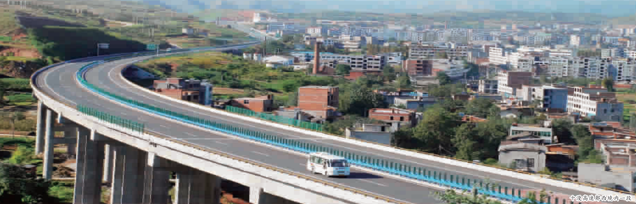
十漫高速郧西境内一段