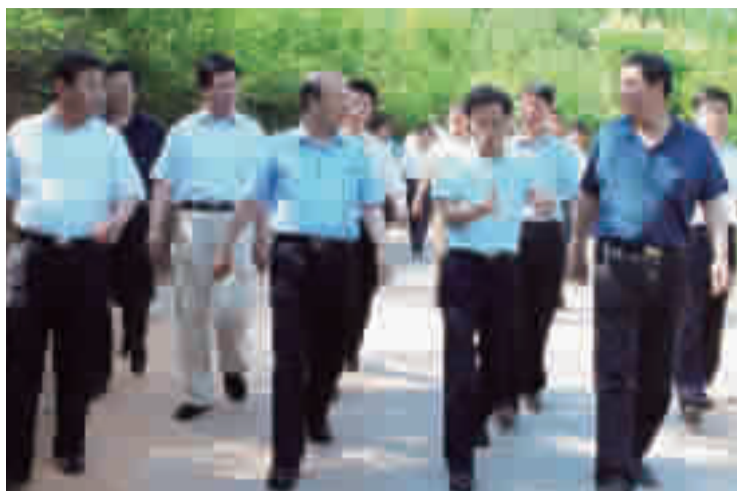
国家交通运输部副部长徐祖远(左二)、省交通运输厅副厅长张云(右二)、省公路局局长范建海(右一)、市交通运输局局长王晋洪(左一)在郧西县调研。