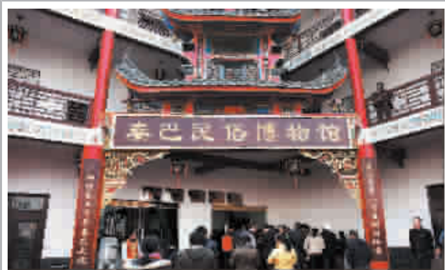
农民曾和林投资 450 万元建成秦巴民俗博物馆

去年,十房、谷竹、十白、鄖十高速公路建设快速推进,鄖十一级公路西段贯通,丹土一级公路全线开工,316国道西部复线一期工程主体完工,竹溪绕城一级公路开工建设,竹山、房县绕城一级公路加快推进前期工作。县乡公路改造完成路基267公里,路面基层195公里,面层175.3公里,建设通村水泥路665公里,完成路面大修114公里。