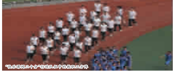
“快乐课间三十分”修建队伍中的教职工师傅

环节六:蛇形走。广播操的音乐一停,全体学生就会自觉地排队等候,待《打靶归来》的音乐一响起,各班的学生会就两两对齐,随着轻松愉快的音乐整齐列队呈蛇形走上楼。今年三月为了弘扬雷锋精神,我们将原来《打靶归来》的音乐换成《学习雷锋好榜样》。蛇形走让学生情绪由兴奋紧张转入平静舒缓的状态,学生生理心理得到充分的调整,同时避免了学生拥挤造成安全事故,训练了学生的集体协作意识,使学生以良好的状态投入接下来的课堂学习。