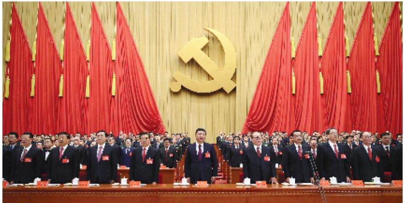
10月18日，中国共产党第十九次全国代表大会在北京人民大会堂开幕。这是习近平、李克强、张德江、俞正声、刘云山、王岐山、张高丽、汪洋、胡德涛在主席台上。

新华社北京10月18日电 绘就伟大梦想新蓝图，开启伟大事业新时代。举世瞩目的中国共产党第十九次全国代表大会18日上午在人民大会堂开幕。