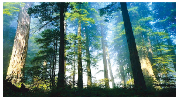
诗经源国家森林公园