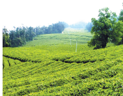
有机茶产业园一角

40年间,公共财政体系逐步完善,民生保障显著增强。1979年,财政民生支出仅524万元,占财政总支出43%,农民赋税繁重,干部工资拖欠严重;2005年全面取消农业税,农业特产税时,全县干部工资已能正常发放,民生支出达11449万元;随着财政收入持续增长,尤其是“十二五”以来,房县财政一直秉持“小财政大民生”的理念,努力将有限财力向民生倾斜,不断加大教育、文化、医疗卫生、社会保障和就业等民生领域投入力度,着力宽领域、多层次、全方位的社会福利体系建设,城乡居民基本养老实现全覆盖,全民医保基本实现,企业职工及城乡居民养老金标准、城乡医保人均筹资标准和低保标准等不断提高,高龄老人补贴、老年人体检和重度残疾人生活补贴制度全面建立,现代化社会保障制度框架基本形成;义务教育经费保障机制持续完善,城乡教育办学条件大幅度改善,城乡教育朝着一体化均衡发展;公共医疗卫生保障机制不断完善,社会保障制度向普惠性迈进,财政保障的公平性和可持续性更加凸显,城乡基本公共服务得到大幅度攀升。2017年,财政用于民生的支出已达31.07亿元,占财政总支出72.5%,全县干