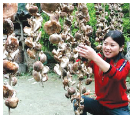
食用菌产业蓬勃发展