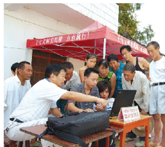
财政干部发放惠农补贴并为群众查询补贴数据