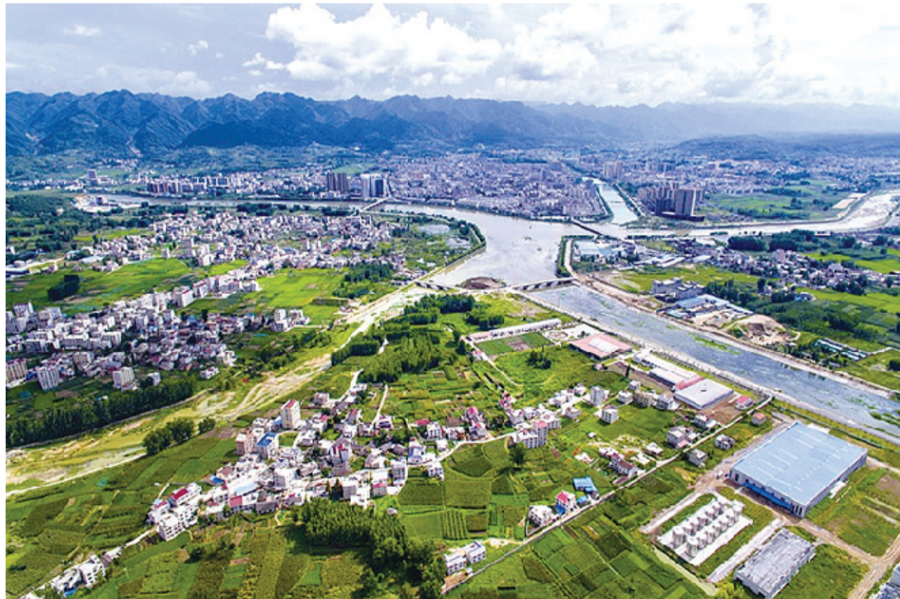
亮丽秀美的房县县城

1978年12月,党的十一届三中全会拉开了改革开放的帷幕,吹响了改革开放的进军号角,改革开放自此以波澜壮阔之势在神州大地展开。40年弹指一挥间。改革开放40年来,房县财政系统全体干部职工在县委、县政府的坚强领导下,乘着改革东风,以强烈的政治责任感、历史使命感和时代精神,在砥砺中前行,在探索中创新,在创新中发展,在发展中跨越,房县财政实现了从“吃饭型”向“公共型”的历史转型,事业发展日新月异。