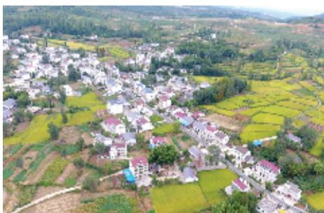
“四好”农村路托起致富新希望

40年间,从肩挑背驮的羊肠小道,到如今“畅安舒美”的康庄大道,房县交通建设实现了从无到有,从小到大的快速攀升,以交通道路的变迁史勾勒出改革开放40年房县社会经济发展的巨大成就。