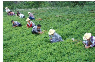
野人谷镇绞股蓝产业基地