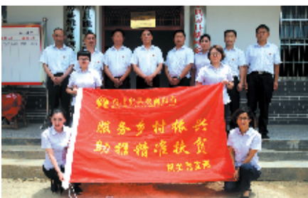
房县农商银行开展“服务乡村振兴 助推精准扶贫”主题党日活动