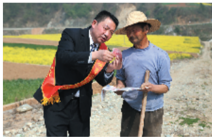
房县农商银行开展金融服务进农户活动