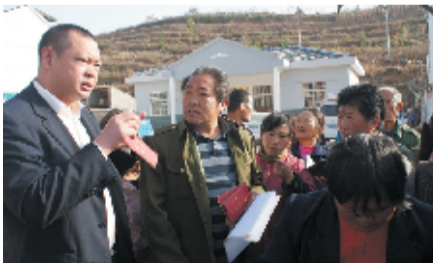
房县农商银行开展“金融知识下乡”活动