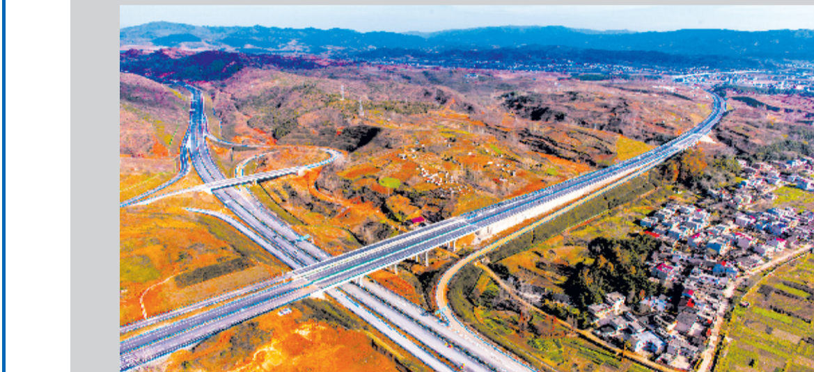
谷村—十房高速房县枢纽互通