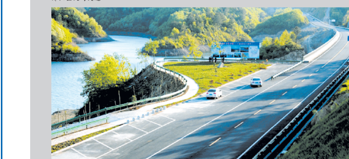
丹江口环库公路停车港湾