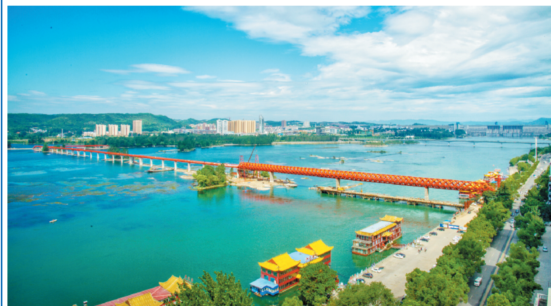
丹江口市沧浪洲湿地步行桥