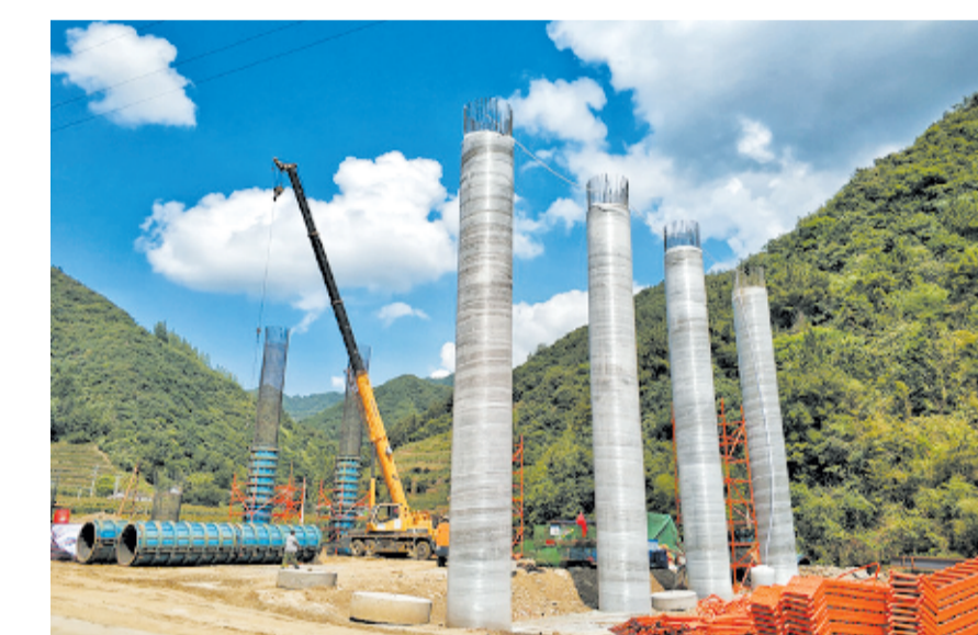
十堰高速拉河7号桥建设现场