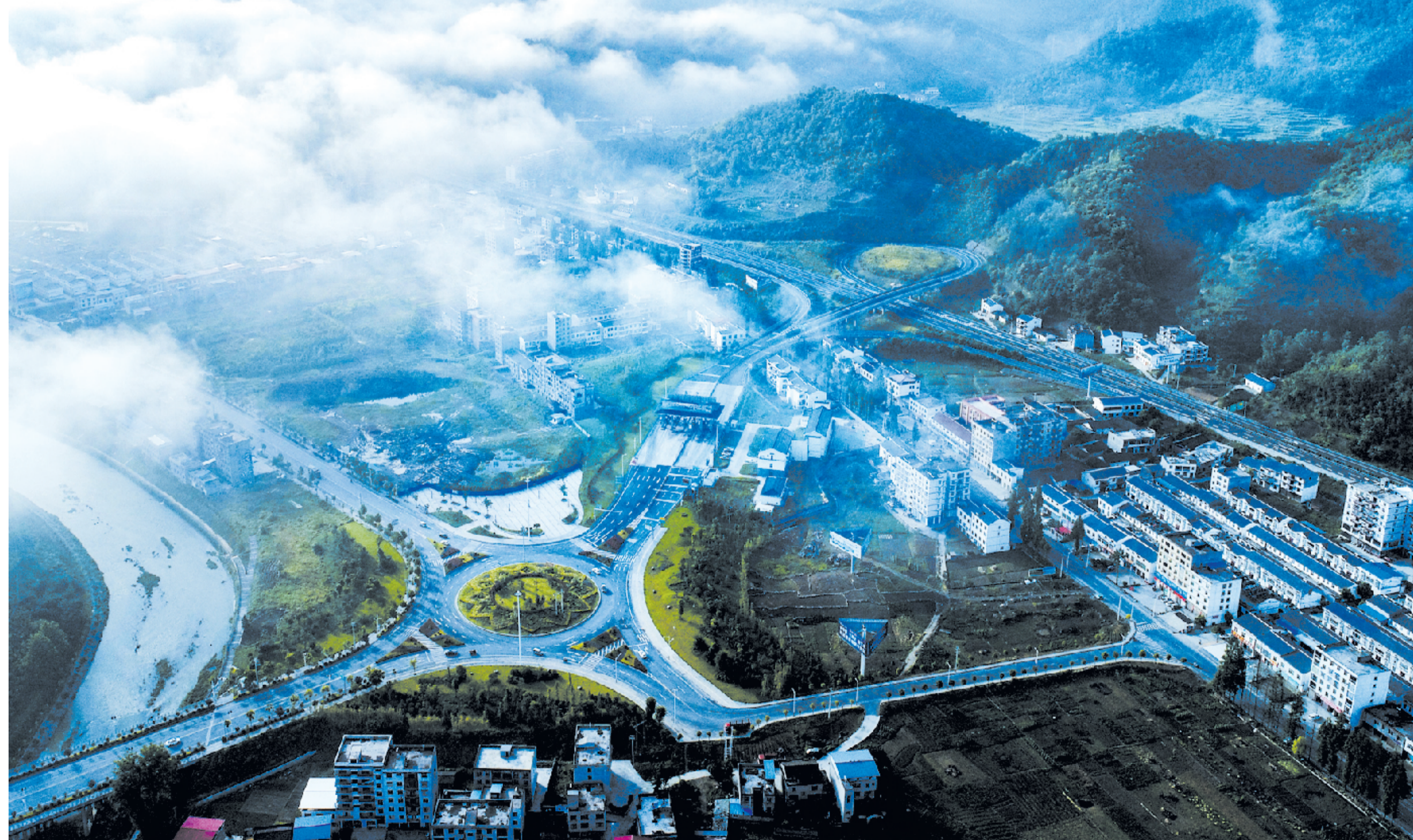
竹溪县交通路网