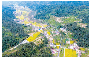
窑湾镇三岔村茶园路