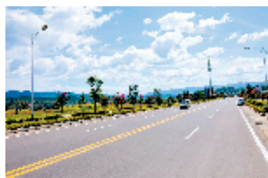
打造人工造景与自然景区协调一致的美丽环境