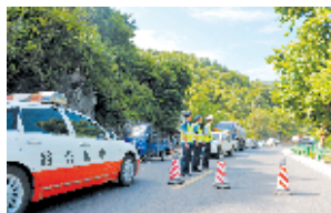
对山体滑坡地点进行交通疏导作业