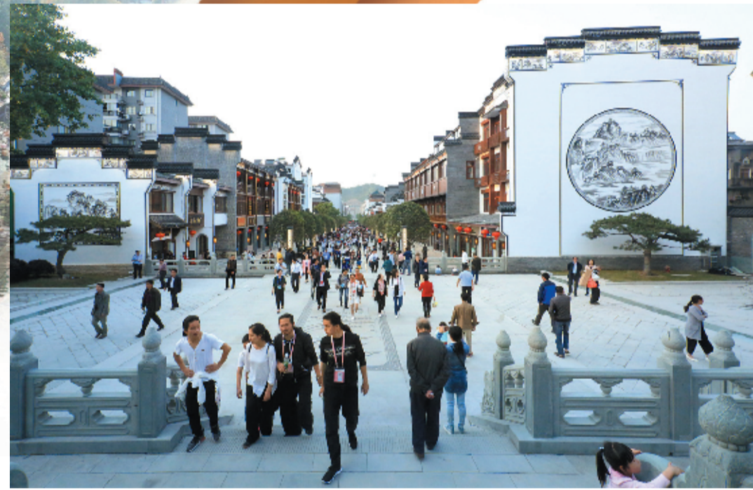
改造后的武当山玉虚街