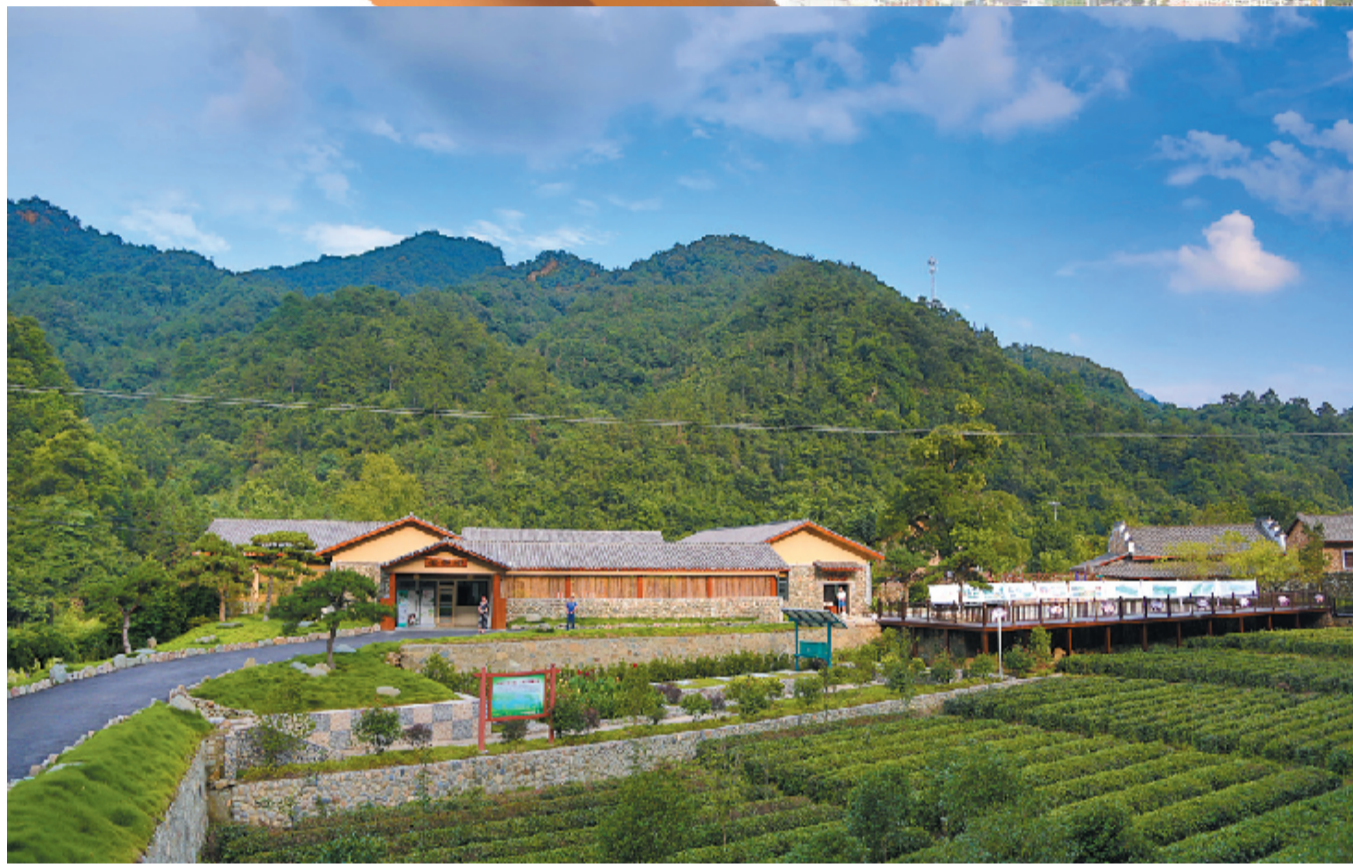
茅箭区全域旅游项目

追梦路上,一山放送一山拦;实现梦想,唯有一锤接着一锤敲。曾经一度沉睡的山城十堰,在加速新旧动能转换的鼓角声中苏醒,在高质量发展的拉力赛中奋起直追,以“一万年太久,只争朝夕”的实干精神,描绘出“春看稻菽千重浪,遍地英雄下夕烟”的宏图。用宽阔肩膀担当,靠真本领成事,十堰市委、市政府牢牢牵住项目建设这个“牛鼻子”,带领十堰在追梦路上完成了“弯道超车、后发先至”的壮举。看巴山上,项目遍地;汉江两岸,如火如荼。2018年,全市固定资产投资和投资计划完成率均走在全省前列,在建的1636个重大项目如一台台补短板、调结构、稳增长、促转型、利生态、保民生的高效引擎,装点巴山,今朝更好看!