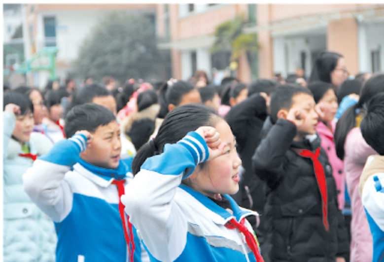
3月4日,市东风小学举办的“雷锋精神永流传”主题系列活动正式启动,学生庄严宣誓。

近年来,竹山县教育局、卫计局等部门联合开展“千老帮千童”关爱活动,由老干部、老战士、老教师、老模范、老党员志愿者与留守儿童结对子,通过办好事、做实事、解难事,充分发挥“五老”余热,助力留守儿童快乐成长。