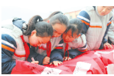
3月4日上午,茅箭区实验小学举行学雷锋活动月启动仪式,5000余名师生齐聚学校操场,在国旗下庄严宣誓,并在宣传横幅上签字。