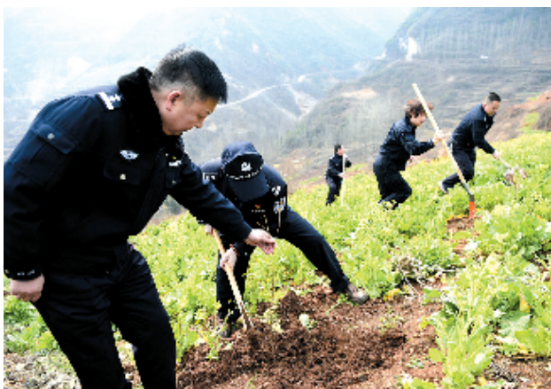
3月7日上午，房县公安局组织60余名机关民警，来到该县城关镇朝阳村垭口山，参加房县县委机关春季植树活动，半天时间栽植优质桃树苗木500余株，面积近百余亩。

当前，陈家堰村盆景种植户们计划成立专业合作社，通过电商平台拓宽销售渠道，提高当地盆景知名度，创造更大的经济价值，引导更多村民通过种植盆景享受到“绿色银行”福利。