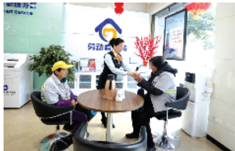
“劳动者港湾”工作人员提供暖心服务

一个诚实守信的企业，让人尊敬。作为金融行业的佼佼者，建行十堰分行始终坚持把每一项诚信服务作为信用体系建设的实践，大力支持实体经济，广泛开展文明创建活动，为我市经济社会高质量发展贡献了积极力量，彰显了责任担当，赢得了广泛赞誉。