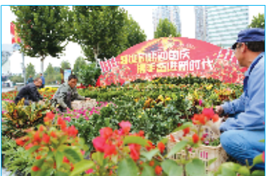
工人们在市人民广场上摆放鲜花盆栽