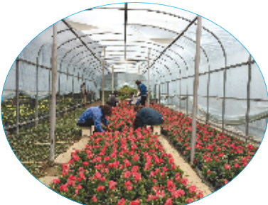
工作人员精心整理出园前的花卉