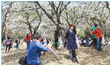
四方山生态公园游人如织