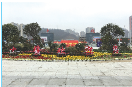
十堰火车站北广场繁花似锦

百尺竿头，每一处绿，其实都彰显着市园林绿化部门奋力争创国家生态园林城市的决心，彰显