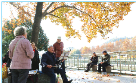
老人们在改造后的游园内拉琴唱歌