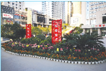
市民服务中心门前花团锦簇