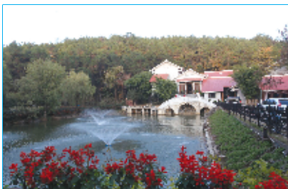
四方山生态公园美景如画