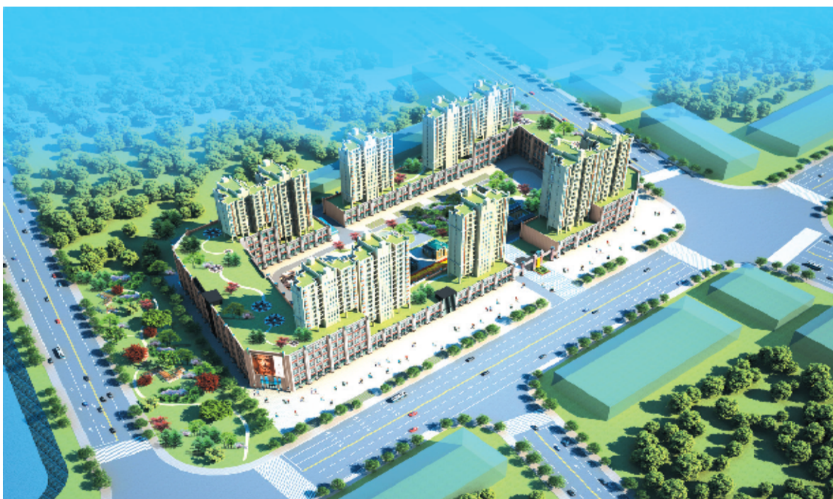
房县诗经花苑商住小区鸟瞰图

立足房县,服务房县,为房县城市化建设作出力所能及的贡献,是十堰众力置业有限公司的价值追求。