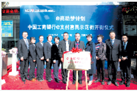
湖北首家e支付惠民街在竹溪县开街。

2018年4月28日,中国工商银行在北京召开创新发展发布会,正式发布“聚焦本源、因势革故、协同高新、永葆生机”创新发展核心理念,为新时期工商银行创新发展提供更加坚实的文化支撑。