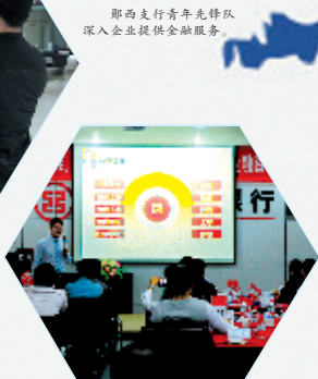
组织开展“赋能中小企业创造间接融资条件,破解中小企业融资难融资贵”系列培训。