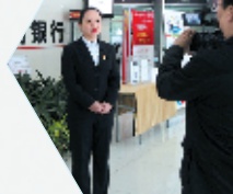
开通社保卡“一站式”便民服务。