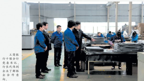
工商银行十堰分行党委书记、行长代表了解企业合作意向。