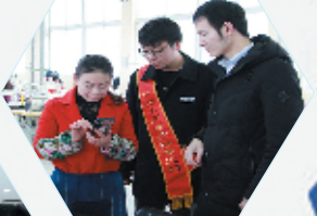
鄂西支行青年先锋队深入企业提供金融服务。