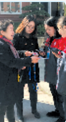
丹江口支行引导市民通过e支付业务交纳水电费。