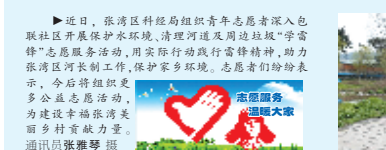
近日,张湾区科经局组织青年志愿者深入社区开展保护水环境、清理河道及周边垃圾“学雷锋”志愿服务活动,用实际行动践行雷锋精神,助力张湾区河长制工作,保护家乡环境。志愿者们纷纷表示,今后将组织更多公益志愿活动,为建设幸福美丽家乡贡献青春力量。

3月27日晚9时许,虽然到了就寝时间,但木瓜小学学生宿舍里依然传出孩子们欢呼声。“学校219个学生娃儿大都是留守儿童,许多孩子即使周末回家也不能好好洗澡。如今再也不用为这事儿犯愁了!”纪贵忠老师高兴地说。