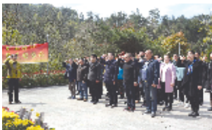
近日,茅箭区五堰街办机关党支部组织党员来到该辖区茅塔乡东沟红色革命传统教育基地,开展“缅怀革命先烈,学习红色精神”清明祭扫活动。

在革命烈士纪念碑广场,全体党员向革命先烈默哀致敬,并重温入党誓词,以表达敬意(如图)。随后,全体党员来到中原突围鄂西北历史纪念馆参观,了解历史和革命烈士的英勇事迹。