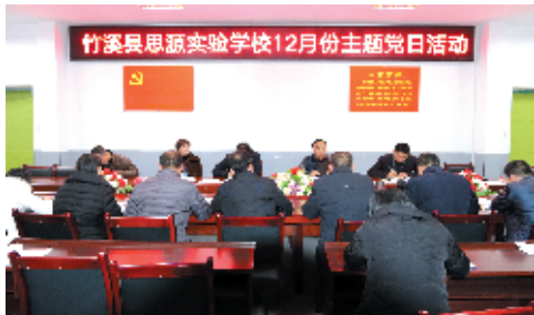
支部主题党日活动