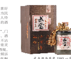
武当酒海原浆 1985一斤装

如今,饮酒文化越来越来多,在原有酒规的基础上,武当山地区逐渐形成了饮酒五部曲,第一部曲“武当细语”,大家初上酒席,互相劝酒,