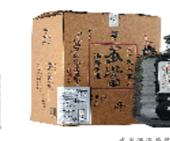
武当酒海原浆 1985三斤装