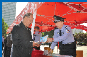
开展防诈骗宣传活动