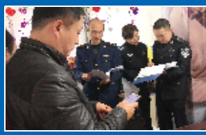
开展矛盾纠纷排查