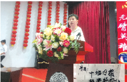
▲何军权给阳光书店学生讲述自己拼搏的故事

从1996年开始,何军权便在国内多项赛事中获奖。在全国第四、五、六、七、八届残奥会上,他共获得金牌14枚、银牌5枚、铜牌5枚。由于在各项大赛中表现出色,他被破格选入国家队备战残奥会。2004年8月,他和队友们代表中国进军雅典残奥会。那段时间,他患上胆囊炎和胃病,担心影响兴奋剂检测,不敢使用任何医治疼痛的药物。为分散对疼痛的注意力,他每天在水中训练4个小时以上,游程