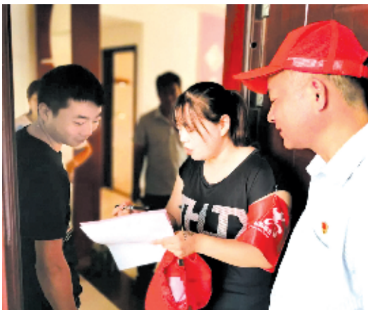
是印社区 户户走到

本报讯 通讯员余颖报道:连日来,市人民检察院组织志愿者走进郢阳区城头镇梁园社区,开展“户户走到”创文志愿服务活动。 “您是否知道我市正在创建全国文明城市?”“您对当前创文工作有什么意见和建议?”活动中,志愿者们向居民宣传创文知识(如:不乱扔乱丢、不乱穿乱挂、乱贴乱画等不文明行为)进行劝导,发动居民积极支持、参与文明城市创建工作,认真记录居民提出的意见建议。 据了解,不久前市人民检察院向郢阳区社区提供资金10万元,用于文明创建相关活动。截至目前,该院已组织60余名志愿者前往梁园社区开展“户户走到”创文志愿服务活动3次,走访274户,发放资料500余份。 下一步,市人民检察院将继续按照市创文办要求,组织志愿者全面开展入户走访,深入了解群众期盼与诉求,大力宣传创文新措施、新成果,确保“户户走到”不漏人、不漏户,将文明创建传达到包联社区每一个角落。