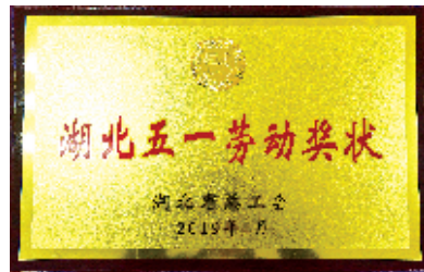
荣获“湖北五一劳动奖状”