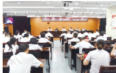
召开“不忘初心、牢记使命”主题教育动员会

队伍凝聚力和战斗力,确保稳健经营。通过大力拓展载体,多思路、多渠道、多形式开展宣传,使党建统领有声有色。目前,该行建有宣传展板、文化墙、学习专栏1000余块;党课、专题研讨、红色教育、支部主题党日等活动定期开展;建立党建清风微信群,开辟《湖北十堰农商银行报》专栏,及时传达党建工作任务要求,扎实推进党性教育全覆盖,有效增强党员干部“四个意识”,推动银行各项事业全面发展。