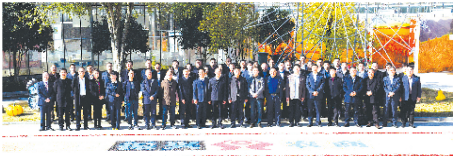
在张湾区黄龙镇坪坪村召开金融服务乡村振兴现场会