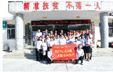
各党支部积极开展“党建互联互通 共促乡村振兴”村银共建活动

干事劲头。全行876名党员干部带头抓业务、作表率,促发展,累计营销ETC五万余个、微贷近7亿元,党员在业务发展中的示范引领作用充分彰显。2019年,湖北十堰农商银行第6次被十堰市委、市政府授予“支持地方经济发展突出贡献金融机构”。同年5月,该行荣获“湖北五一劳动奖状”殊荣。全系统内涌现出60余个全省先进社和市行党委表彰的先进集体和先进个人。截至8月底,全行人均存款、利润总量、人均利润、成本收入比、资产利润率、ETC营销等多项指标位于全省系统前列,为十堰经济社会高质量发展贡献金融力量。以党建推动高质量发展的湖北十堰农商银行,正用优异的成绩向中华人民共和国成立70周年献礼!