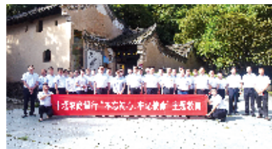
“不忘初心、牢记使命”主题教育走进红色教育基地