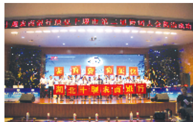
连续两年冠名支持十堰市诗词大会

了由党委书记、行长任组长的主题教育领导小组,上下一盘棋推动主题教育开展。紧扣习近平新时代中国特色社会主义思想主线,围绕“三大银行”建设目标,按照省市行“7+3”十年行动计划要求,结合经营发展实际,制订了详实具体明确的活动方案,将主题教育与服务乡村振兴、服务民营企业、村银党建互联互通、党员干部“比作风、晒业绩”、打赢“四大战役”等五大专题相结合,突出十堰特色,突出具体工作,突出业务实效。对照主题教育十条要求落实到具体时间节点、完成方式、责任人员,形成主题学习、主题研讨等十大主题活动,并通过“一表六到位”形式制定时间安排,明确专人专责推动,确保活动不走形式、不走过场。