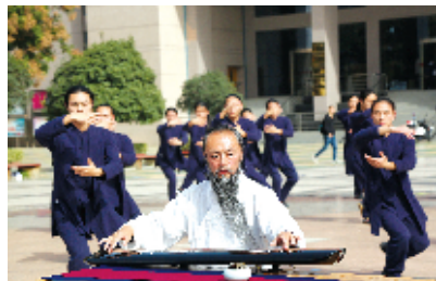
琴声悠扬回荡校园