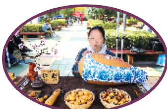
武当艺人在葫芦上烙画