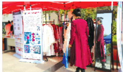
武当服饰备受青睐