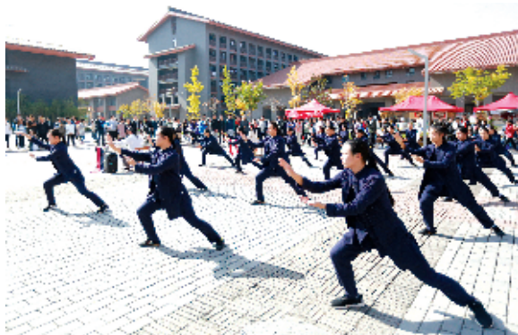
武当武术西安“快闪”