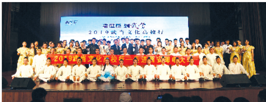
武当功夫团和高校师生代表合影