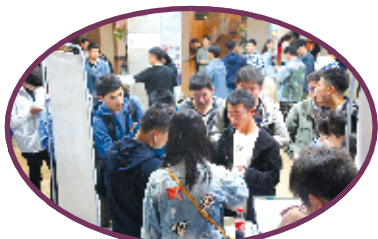
同学们在领奖处排起长队

10月30日晚,随着在西安邮电大学的文化演出顺利结束,由武当山特区主办的“2019武当文化高校行”活动完美收官。10月28日至30日,武当文化走进陕西高校,为长安大学、西安建筑科技大学、西安邮电大学的学子们带来了一场视听盛宴,吸引了近万名学子前来观看。