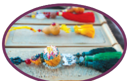
武当文创产品精美