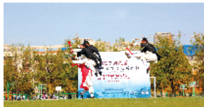
武当功夫惊艳亮相