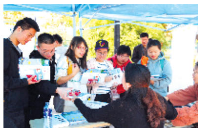
武当旅游大受欢迎