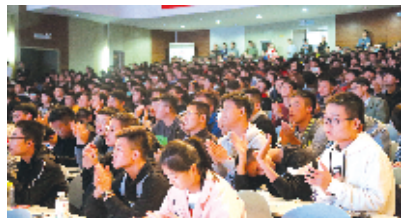
演出现场掌声雷动