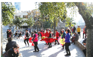
改造后的背街小巷成为市民休闲放松乐园

背街小巷是一座城市的毛细血管,其畅通与否,直接关系到百姓生活、城市文明。近日,记者在十堰经济技术开发区白浪街办吕家巷、茅箭区武当路街办泰安巷等背街小巷及周边老旧小区采访时看到,经过一系列改造升级,如今路平了,排水通畅了,白墙、青瓦、绿植相映成趣,背街小巷及老旧小区展露新颜。