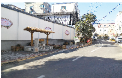
十堰经济技术开发区白浪街办吕家巷华丽“变身”。