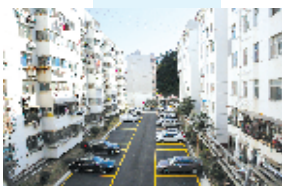
张湾区红卫街办周家沟社区光明小区车辆停放整齐。

近年来,我市始终坚持“为民创建,创建为民”的宗旨,针对背街小巷和老旧小区存在的路面坑洼不平、环境脏乱差、各类设施不够完善、绿化缺失等问题进行综合整治。通过集中整治,全市535个老旧小区成为“洁净美”的幸福小院,156条“路不平、灯不明、水不畅”的背街小巷成为景观路,实现“颜值”“品质”双提升。市民在生活质量大幅提高的同时,也真切感受到创文带来的美好变化。