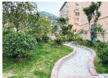
改造后的张湾区汉江路街办阳光社区绿化带绿意盎然