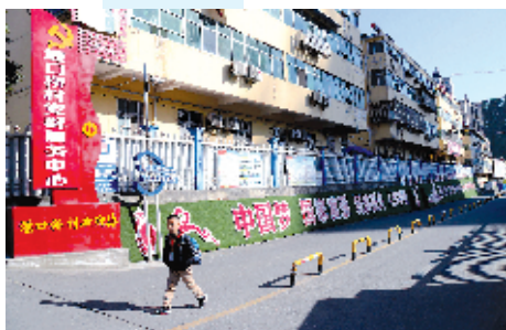
十堰经济技术开发区白浪街办中观社区福安小区一角