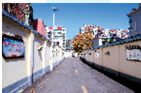
十堰经济技术开发区白浪街办小东巷焕然一新