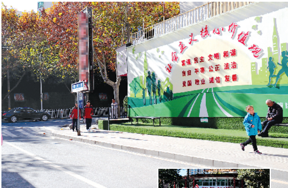
茅箭区武当路街办泰安巷新铺的沥青路面整洁美观