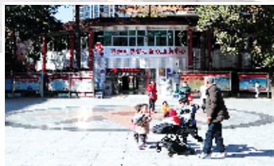
居民在改造后的茅箭区五堰街办燕林小区广场休闲