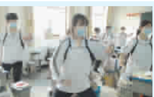
为减轻高三学生心理压力,助力高三学生轻松迎考,近日,丹江口市二中开展学生课内减压主题活动。

市教科院党委书记、院长潘智勇指出,此次会议以七市联考为契机,全面分析了七市的考情,总结了前期的复习备考工作,为后期备考计划的调整、措施的修订、策略的优化提供了科学依据和有力支撑,为高效率的备考指明了方向。面临疫情新形势,各校要立足防控优先的原则,做到防控和备考两手抓,全市高三任课教师要全力服务学生的复习备考和身心健康;各校要加强疫情防控,确保师生安全,要找准重点,精准备考,决战2020年高考。要做到明确目标、科学谋划、精准施策,务实高效,为我市高考质量稳步提升而努力。