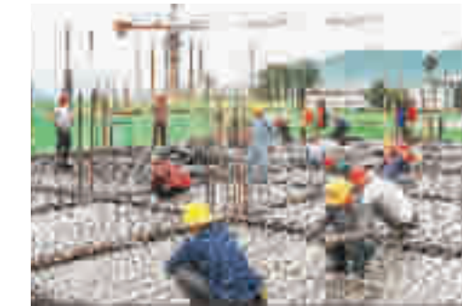
6月3日,在竹山竹山鱼岭村工业园的行知外国语学校建设现场,工人正在绑扎钢筋。该工程是2019年竹山县招商引资的重大民生工程,经茅箭区教育集团投资建设,是集小学、初中、高中教育于一体的15年一贯制民办公办学校,学校占地170亩,投资3亿元,规划100个教学班,可容纳4500名学生就读。