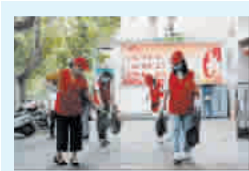
柏林镇开展爱国卫生运动，提升乡镇容貌和文明程度。

截至目前，集镇共清理卫生死角13处，修补破损路面19处，补植绿化带100余株，清理乱搭乱建11处，增补沟盖板5处。通过整治，乡镇容貌得到进一步改善，有力助推了“美丽集镇”建设。