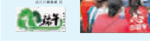
南湾村开展包粽子、品端午活动，弘扬传统文化。

为弘扬传统文化，让辖区群众深入了解传统节日，增加爱国情感，6月20日，张湾区汉江西路办事处南湾村开展“传承文明 品味端午”主题活动。活动通过包粽子、“晒”粽子等形式，让居民们感受到大家庭的温暖，也进一步增进了邻里之间的感情，营造了浓厚的传统文化氛围。