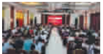
6月19日,茅箭区五堰街办组织全体机关干部,下辖区各社区(村)干部、网格员、执法大队全体成员在街办新时代文明实践所集中学习《民法典》,以此增强广大党员干部法治意识。

本报讯 通讯员方璐 王婧报道:“复工复产中有什么困难?员工防疫物资准备充足吗?”近日,白桑关镇纪委工作专班来到该镇汽车坐垫厂了解复工复产、疫情防控情况,听取企业意见建议。 为确保镇内企业顺利复工复产,白桑关镇纪委坚持一手抓疫情防控监督,一手抓企业复工复产监督,通过实地察看、个别访谈、集中座谈等方式,直下下沉企业包联领导不作为、慢作为、乱作为等形式主义、官僚主义问题,以强有力的监督保障企业稳定有序复工复产。