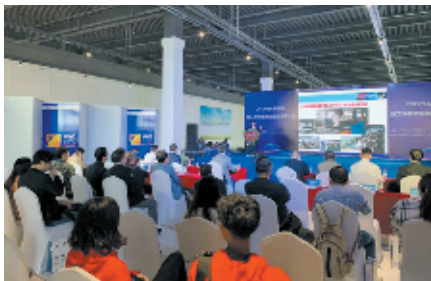
高峰论坛(资料图片)