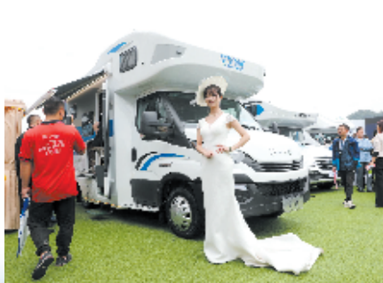
房车展示(资料图片)