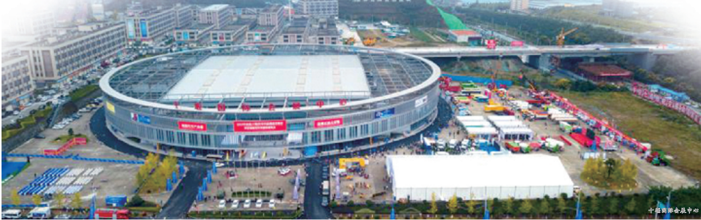
十堰国际会展中心

据悉,丹江口市重点汽车骨干企业均通过质量、环保、安全等多项国际体系认证,产业链从传统商用车零部件向乘用车领域延伸,60%以上的产品用于东风公司装车,并与多家品牌汽车制造企业建立配套关系,有总成配套、整车改装能力,具有年产传动轴100万根、曲轴10万根、凸轴15万根产能,能提供整车生产配套的大部分产品,专用车公告目录已超过200个,涵盖八大系列10多种。