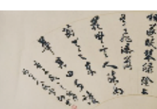
司空图二十四诗品典雅