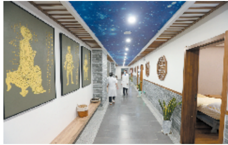
养生中心舒适的内部环境

记者了解到，中央监护系统相当于手术中后期全程化监测的“第三只眼”，相较于传统的系统，此系统整合了麻醉、监护及呼吸全部的信息，手术患者的心跳、血压、呼吸等情况全部集中在一个界面上，一旦有任何异常，手术临床医生可以迅速采取应急急救措施，大大提高了手术的安全性。