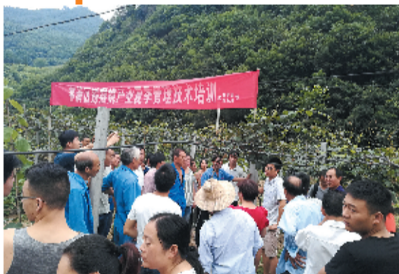
开展猕猴桃产业管理技术培训