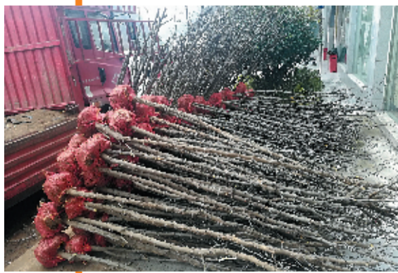
给辖区扶贫点送苗木