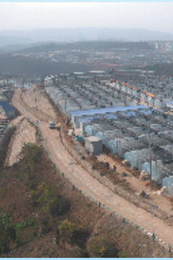
支持郧阳区香菇小镇产业扶贫项目