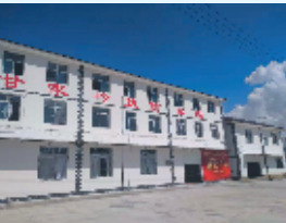
竹溪县甘霖村扶贫车间

动效应，为助力该区打赢脱贫攻坚战发挥了重要作用。为确保贫困户搬得进、稳得住，该行还聚焦深度贫困地区，化金融活水为扶贫甘霖，全面落实总行帮扶深度贫困县差异化政策28条和新10条，致力于安居工程基础设施建设和完善，持续支持深度贫困地区农村公路、农村人居环境改善、水利建设、贫困村提升工程建设，打通脱贫攻坚“最后一公里”。截至今年9月，累计投放易迁后扶贷款3亿元，占全年易迁后扶贷款投放任务的78.9%。已累计在5个深度贫困地区投放扶贫贷款25.87亿元，完成全年深度贫困地区扶贫贷款投放任务的139.84%。