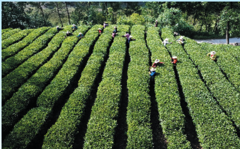
支持竹溪县龙王堰茶叶基地建设

决胜小康，金融先行。十堰市秦巴山区集中连片特困地区，也是湖北省脱贫攻坚的主战场。特殊的市情和贫困情况决定了金融扶贫工作的任务之重、责任之重。作为国家政策性银行，农发行十堰市分行始终以服务脱贫攻坚统揽农村工作全局，充分发挥金融服务脱贫攻坚的先锋主力军作用，积极承担金融扶贫使命，聚焦深度贫困地区扶贫攻坚，全力以赴打好金融扶贫攻坚战，取得了较好的政治、经济和社会效益。今年1至9月，全行累计发放扶贫贷款37.2亿元，完成全年扶贫贷款任务的145.3%，扶贫贷款余额182.83亿元，贷款累计发放额和余额保持全市金融行业前列。