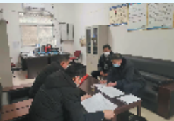
农发行十堰市分行工作队与郧阳区柳陂镇陈岭村村委会议扶贫措施