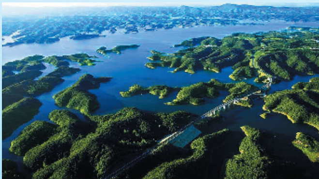
支持建设的丹江口市环库公路美景如画