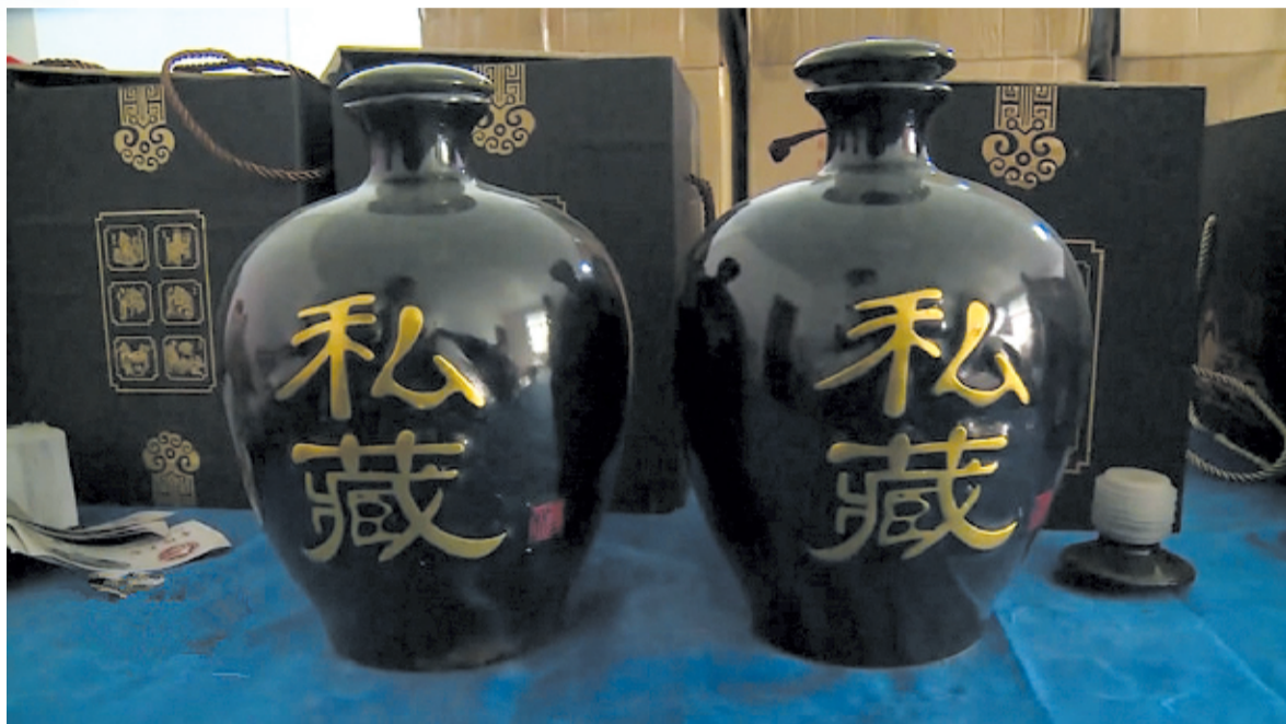
远近闻名的中坝村大曲酒