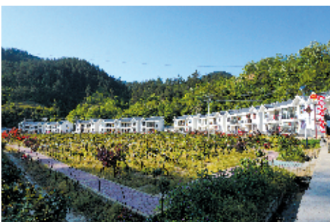
生态移民搬迁小区

“目前，五台乡已初步实现了‘村村有产业、户户有项目、人人有事做、劳动有收入’，全乡所有贫困户已脱贫摘帽，四个村已全部脱贫出列，农村年人均可支配收入达到10000元。村级基础设施不断改善，基本公共服务水平稳步提升，群众获得感持续提升。”五台乡党委书记马宗敏说，“今后，我们将依托‘一片林、一库水’，修好一条生态路，打造香炉垭森林康养基地、森林集镇、红场村观光农业、金牛寺生态茶庄、龙潭峪观坝探洞游古南河五大节点，构建绿色发展布局。”