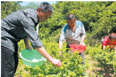
龙潭峪村民收获金银花

“一绿浑无际，茫茫万顷连。”走进房县五台乡，无论是青龙山绵绵的林海、三里坪电站水库粼粼的清波、蔡家垭云雾缭绕的茶山，还是红场村田野上那一抹金黄……无不镌刻着这个山区乡镇走“绿富美”之路的坚实足迹。