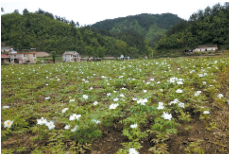
红场村中药材基地

“把百姓关心的事办好，让百姓住上好房子、过上好日子、养成好习惯、形成好风俗，就是我们最大的心愿。”五台乡党委政府领导班子对此有着深刻认识。