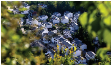
郧阳区乡村建设美如画