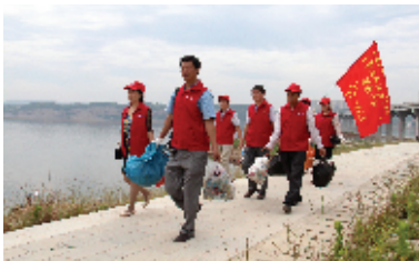
志愿者在汉江沿岸捡拾垃圾

近三年来，郧阳区统筹推进使用各类资金8000余万元，建成农户无害化厕所4.76万座、各类公厕633座，农村无害化厕所普及率达90%以上。一体推进改房、改水、改厨、改院，全面提升农村人居环境，建设美丽家园。