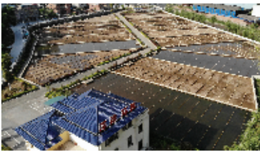
今年以来，郧阳区神定河沿线污水被纳入污水处理厂处理