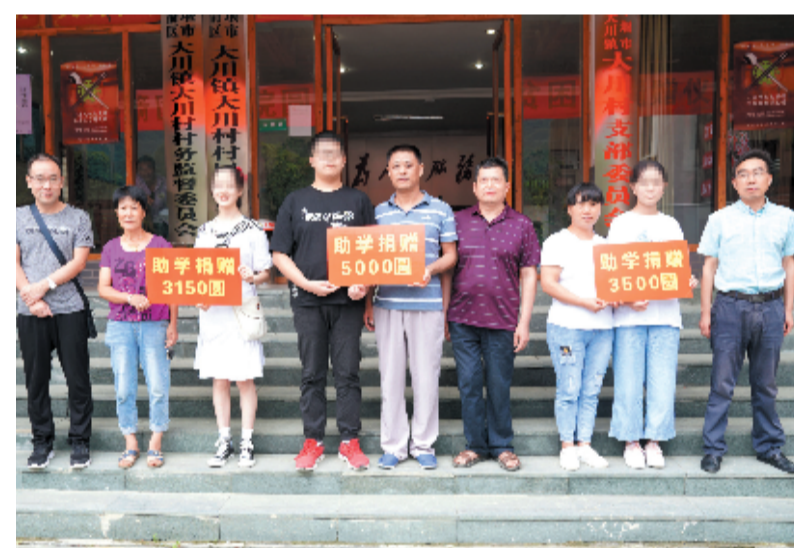
茅箭区人民检察院向包联村贫困孩子捐款

“感谢检察官对我们的关心,我以后一定继续努力学习,争取将来做一个对社会有用的人!”今年8月19日上午,茅箭区大川镇大川村三名中、高考学生,在收到茅箭区人民检察院为他们募集的助学款后感动地说。 茅箭区人民检察院自包联帮扶大川村以来,多措并举开展精准扶贫工作。今年8月,茅箭区人民检察院了解到大川村的三名学生在今、中考中取得了良好成绩,分别被武汉大学、十堰市中等专业学校录取。为传承美德,减轻贫困学生家庭经济压力,茅箭区人民检察院迅速组织开展募捐活动。该院干警们踊跃参与,争当“圆梦使者”,为三名学生募集助学款共计11650元。 “我们希望用尽自己的一份薄弱的力量,力所能及帮助孩子们,让他们在求学追梦的路上感受到检察官的关心和温暖。”参与此次活动的干警们纷纷表示。 近几年来,茅箭区人民检察院在开展精准扶贫工作中以“扶先扶智、资助先立志”为价值导向,以“一人成才,全家脱贫”为目标,认真落实“一库一卡一册”管理机制,推行教育保障全覆盖机制,努力做到帮扶对象精准到人,帮扶政策覆盖到户,帮扶资金精准到账。共计落实教育扶持资金50户67人,覆盖率达100%,鼓励大中专贫困生办理助学贷款,共计为60名大学生申请助学贷款12.4万元,用实际行动助力教育扶贫,为孩子们圆梦之路保驾护航。