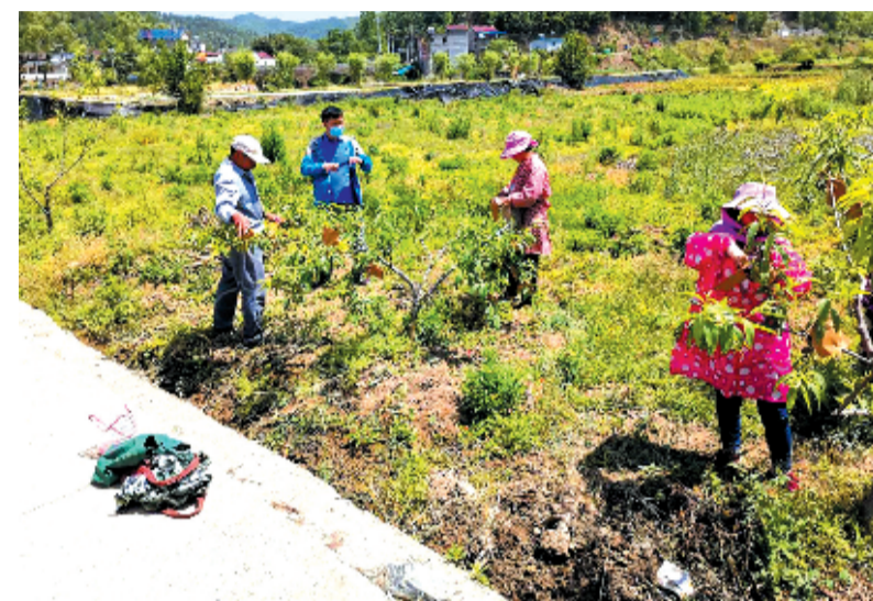
房县人民检察院驻狮子岩村工作队组织农户修筑猕猴桃叶

今年,市人民检察院驻村工作队对白马山村的贫困户开展司法救助,防止他们“因案返贫”。司法救助与精准扶贫的完美结合,既解决了贫困户当前的经济困难,又落实了贫困户往后的生活保障,为贫困户带来了温暖与希望。 帮到心坎上,扶出实效来。市人民检察院全体帮扶干部用实干为谱写新时代(白马篇),让村民们在小康路上“春风得意马蹄疾”。