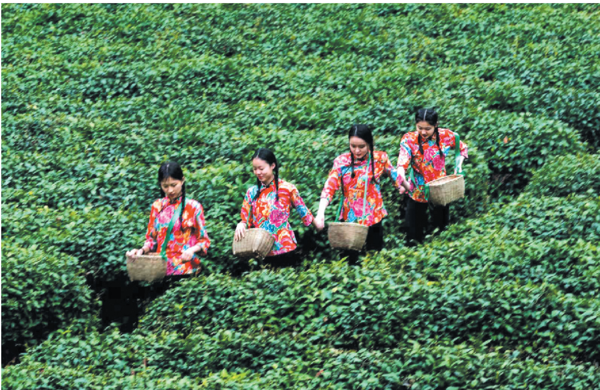
张湾区柏林镇白马山村第五届民俗文化旅游节上,采茶的村民成为一道亮丽风景。