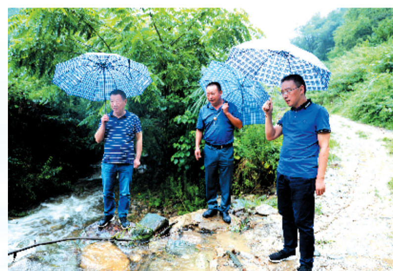
张湾区人民检察院工作组指导帮扶村防汛抗灾

11月13日,记者走进张湾区花果街办桃子村,只见依山而建的安置楼整齐气派,穿村而过的柏油路通达便捷,国家3A级景区百龙潭清凉秀美。而在和张湾区人民检察院“情融心”,桃子村还是个“藏在深山人不知”的穷山村。 对能下苦“拔穷根”。张湾区人民检察院结合实际,指导该村确立“发展城郊山生态旅游,打造城市山体公园,走文旅农融合”的脱贫思路。 要想富,先修路。为打破桃子村旅游产业发展瓶颈,该院协调区移民局、区交通运输局,花掉办公、投资800余万元修建5公里旅游公路,与十堰城区路网连接,公路修通后,从十堰城区中心到桃子村,乘车只需10分钟。 引资金,促升级。完善旅游开发基础设施,该院先后投资200万元帮桃子村通水通电,争取项目资金2000余万元,对景区进行提档升级,如今的百龙潭风景区,旅游步道穿岩过涧如金龙戏谷,观光缆车从桃子村上空掠过,苍松秀竹尽收眼底。娱乐、休闲、餐饮等配套设施不断完善,大大推动旅游产业发展,让村民吃上了“旅游饭”。 “强造血”,增动能。今年,该院协助桃子村筹资办第二届百龙潭漂流赛,为景区发展聚集了人气,营造了气氛,扩大了知名度。百龙潭景区年均接待游客30余万人次。旅游开发帮桃子村增强了“造血”功能,张湾旅游带动村民致富已初显成效。2018年,全村41户贫困户全部脱贫。