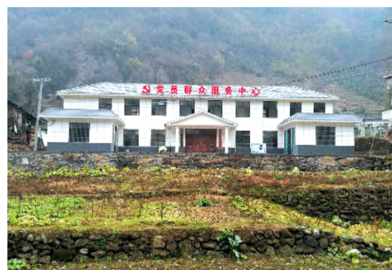
郧阳区人民检察院援建的鲍峡镇孤山村党群服务中心

2017年,房县人民检察院工作队进驻该县门古寺镇狮子岩村后,为推动该村实现集体经济增长,贫困户收入增加,先后流转荒坡地50亩,把流转荒地作为全村增收致富的有效途径。基地共吸纳贫困户、老弱劳动力100余人,以“党支部+合作社+基地+农户”的发展模式,“租金+资金+分红”的分红模式和“果树产业+观光农业”的脱贫规划为牵引,大大激发了村民干事创业热情。 就在狮子岩村发展猕猴桃产业的同一年,房县人民检察院驻门古寺镇石龙沟村工作队也在石龙沟村原性春养殖专业合作社基础上,帮助该村筹集项目资金,新建牛舍、饲料仓库,购买黄牛50多头、饲料加工机械2套,大力发展秦巴黄牛养殖产业。养殖场建成后,每年可出栏肉牛10余头,不仅增加了村集体收入,也在饲料供给、饲养管理方面带动贫困户实现务工增收。 截至目前,在房县人民检察院驻村帮扶工作队的帮助下,两个村的3个合作社采取资金入股、土地入股、技术入股、增收分红的形式,先后吸纳和带动103户317人,大力发展种植、养殖产业,贫困户人均增收4500元。利用“互联网+”打通线上线下营销渠道,多种模式带动贫困户增收脱贫,确保“引进来,养起来,卖出去”。通过积极引导留守人员到扶贫车间务工,合作社雇佣帮扶村贫困户,对接外地用工企业等形式,年均实现劳务输出360人,人均增收24000元。