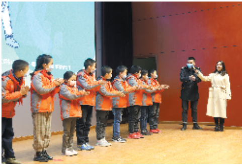
张湾区卫生监督工作人员指导学生学习“七步洗手法”。