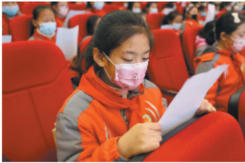
张湾区阳光小学学生在小记者的带领下诵读卫生健康倡议书。

本报讯 记者罗杰 见习记者展展 通讯员赵响报道:“幸福张湾,健康先行”,这是张湾区卫生健康局秉持的初心。11月27日,张湾区卫生健康局携手十堰日报社小记者走进张湾区阳光小学,开展“防疫知识进校园 争做健康小卫士”主题活动。 本次活动由张湾区卫生健康局、十堰日报社教育周刊编辑部主办,张湾区卫生监督综合执法局、张湾区阳光小学、十堰日报社小记者培训中心承办,张湾区疾控中心、张湾区人民医院、李澳生物科技(湖北)有限公